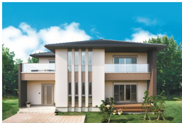
主力商品 「大安心の家」