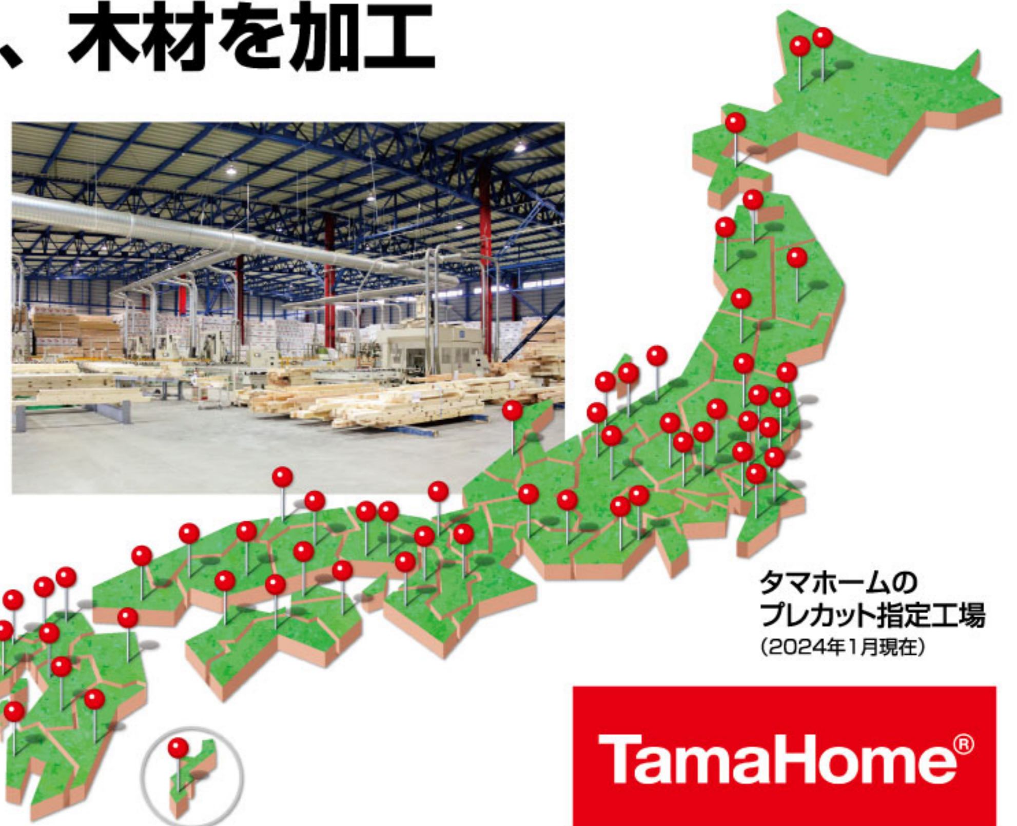
タマホームの プレカット指定工場 (2024年1月現在)

社内に加工図を設計する専門の部門を設け、厳しい構造設計基準を確実に現場へ反映させ、全国に均一で安定した品質の構造材を供給しています。