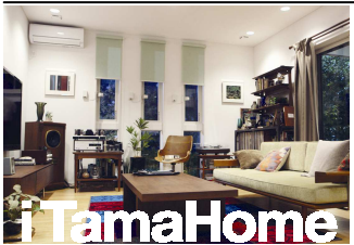
「i TamaHome」のテレビCM収録に使用された新越谷店 (埼玉県)・モデルハウスのリビング